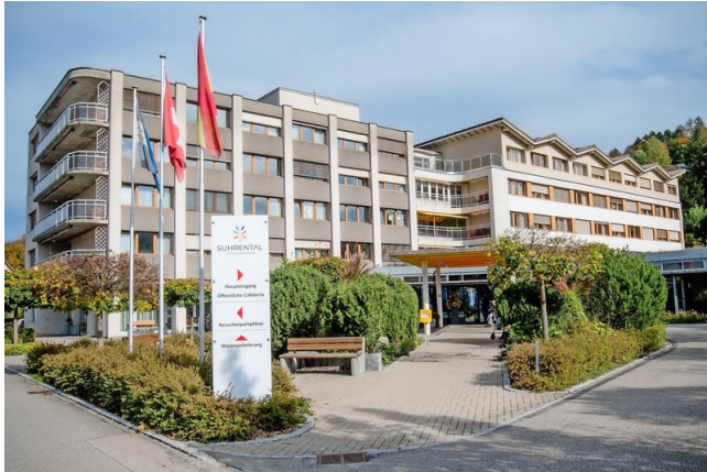
Es gibt einen Abbruch statt einer Sanierung: Das «Suhrental Alterszentrum» in Schöftland.

Urs Helbling, Aargauer Zeitung - zuletzt aktualisiert am 28.05.2021 28.05.2021 09:59 0 0